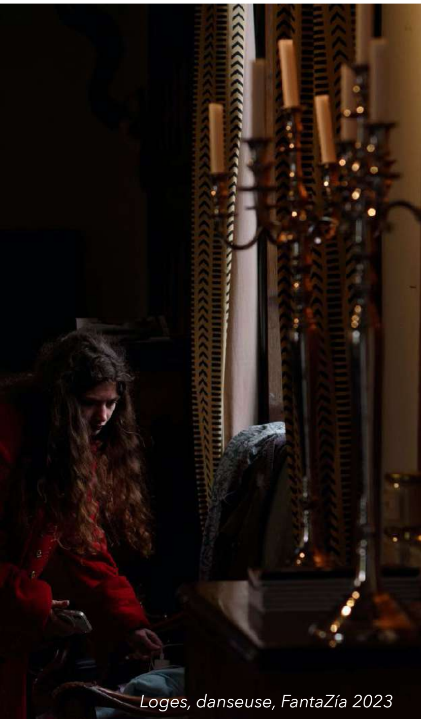
Loges, danseuse, FantaZía 2023