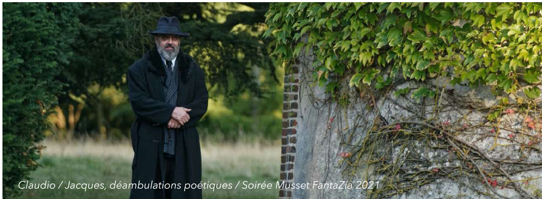
Claudio / Jacques, déambulations poétiques / Soirée Musset FantaZia 2021