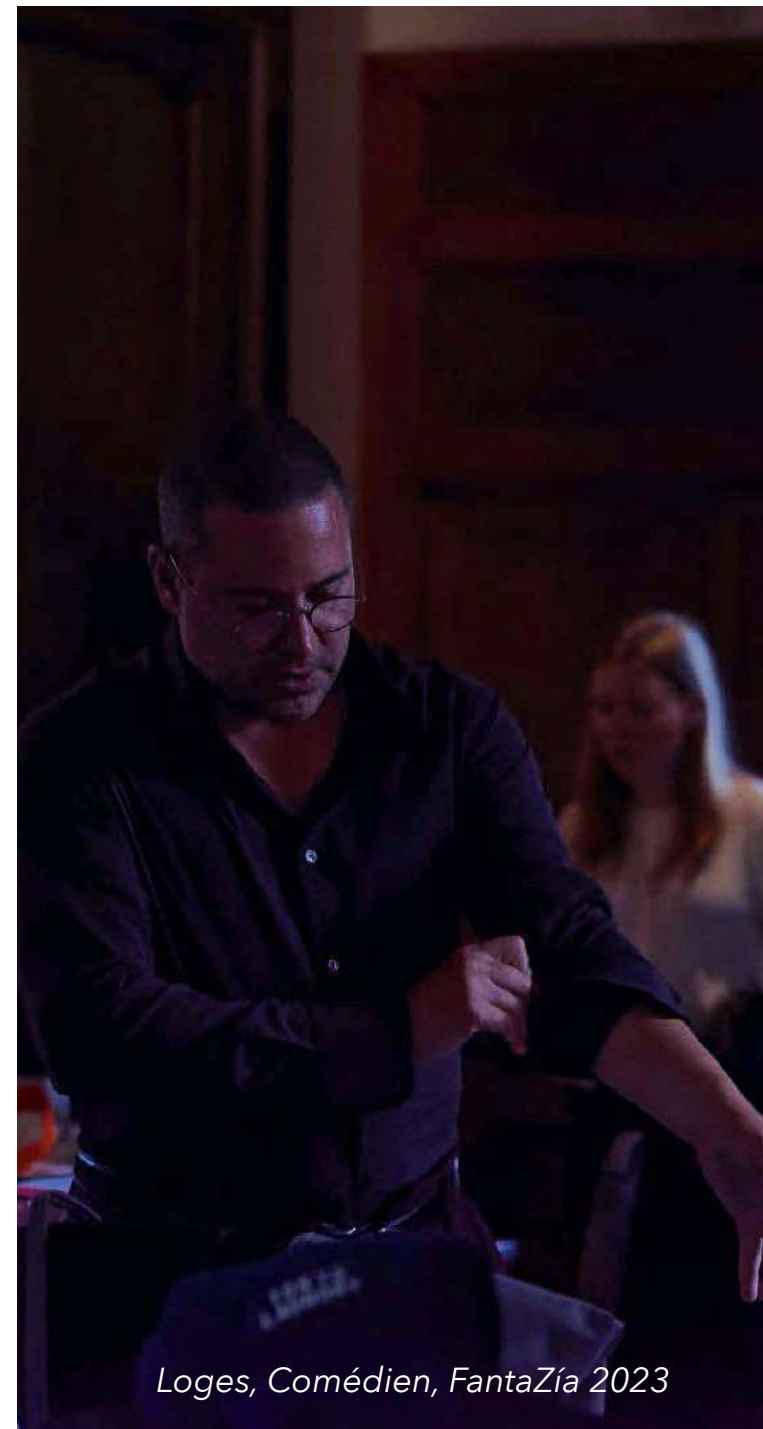
Loges, Comédien, FantaZía 2023