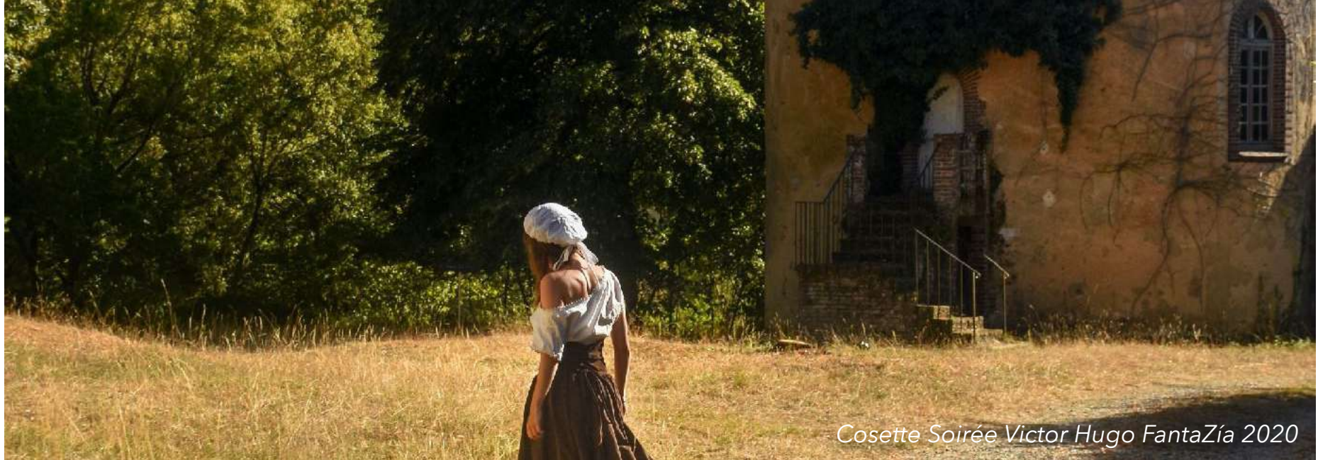
Cosette Soirée Victor Hugo FantaZía 2020