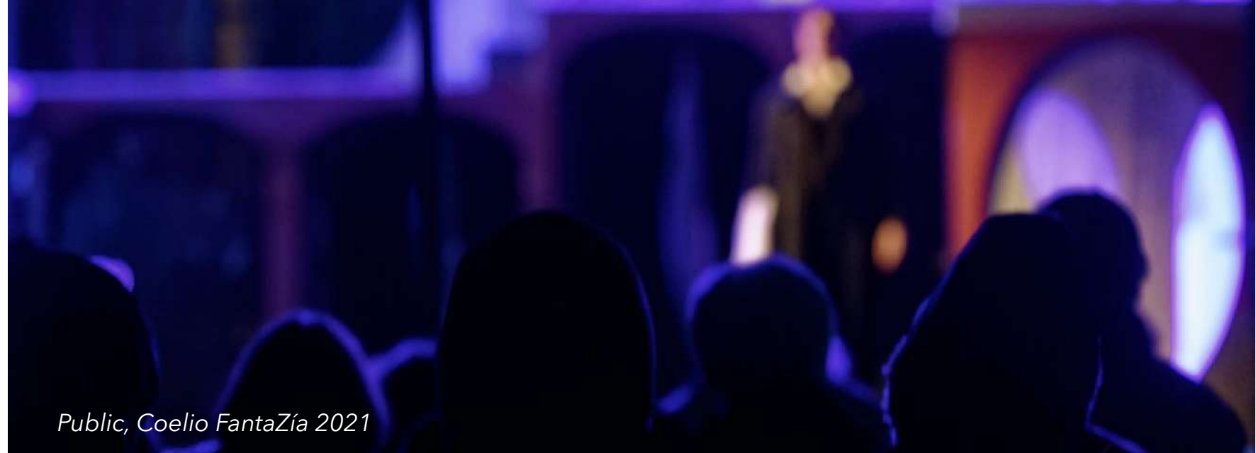
Public, Coelio FantaZía 2021