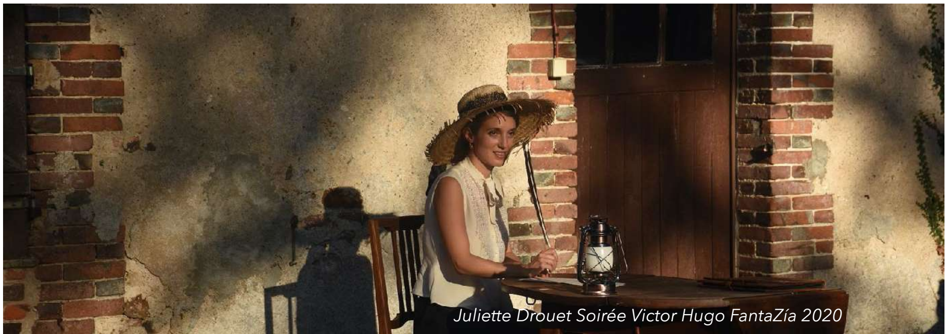
Juliette Drouet Soirée Victor Hugo FantaZía 2020