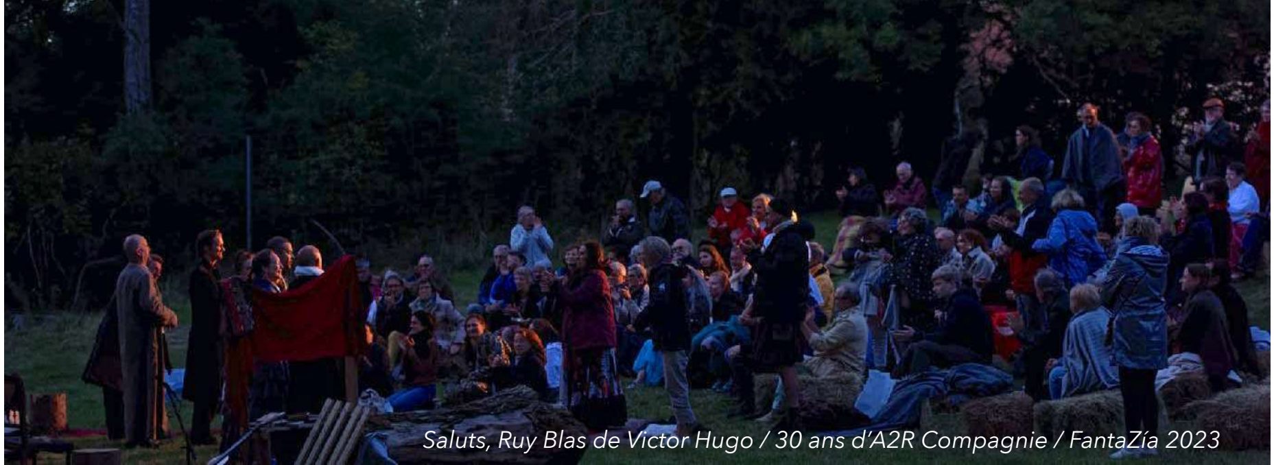
Saluts, Ruy Blas de Victor Hugo / 30 ans d'A2R Compagnie / FantaZía 2023