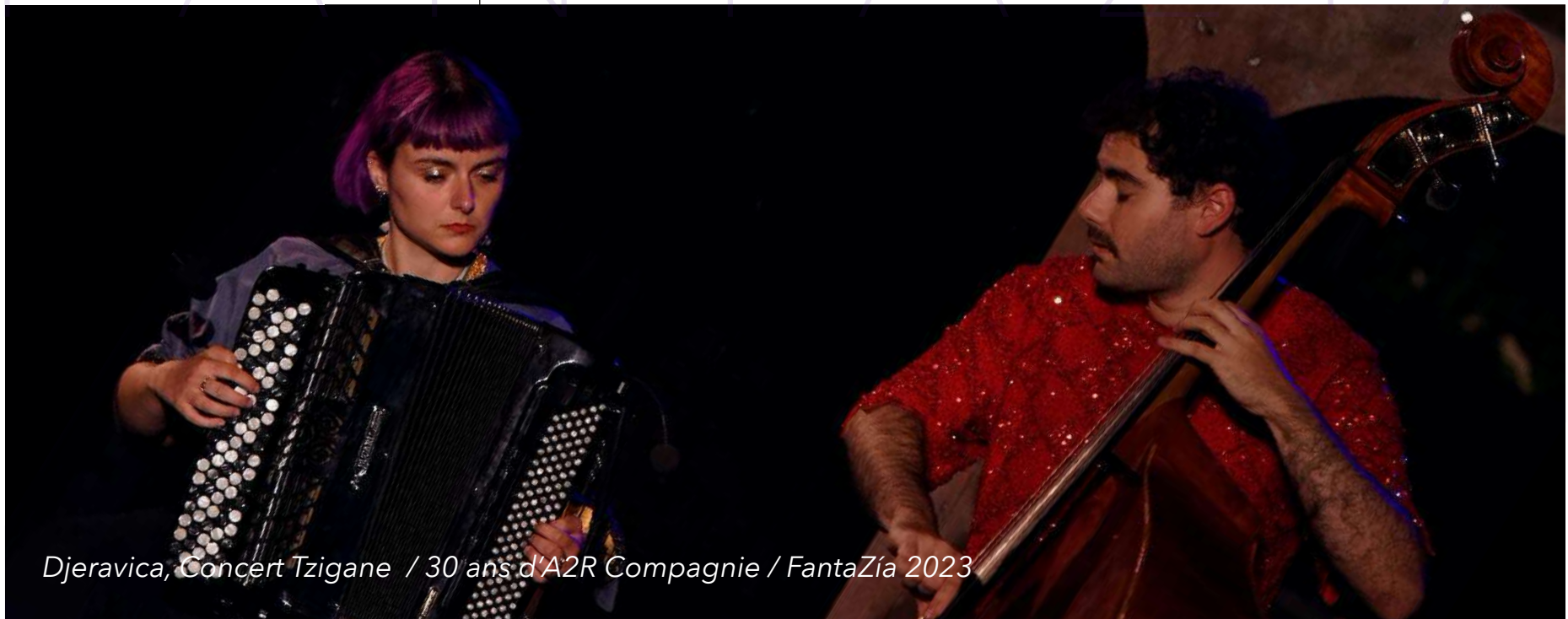
Djeravica, Concert Tzigane / 30 ans d'A2R Compagnie / FantaZía 2023