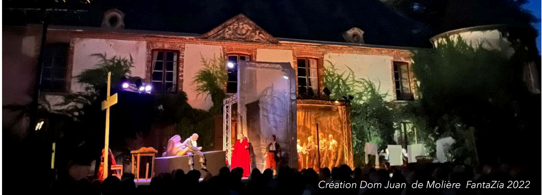
Création Dom Juan de Molière FantaZía 2022