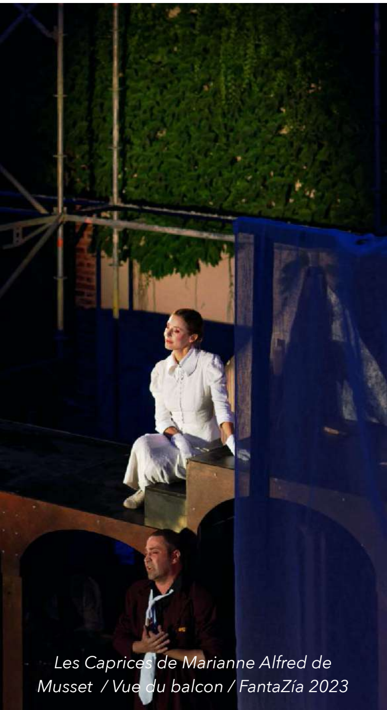
Les Caprices de Marianne Alfred de Musset / Vue du balcon / FantaZía 2023