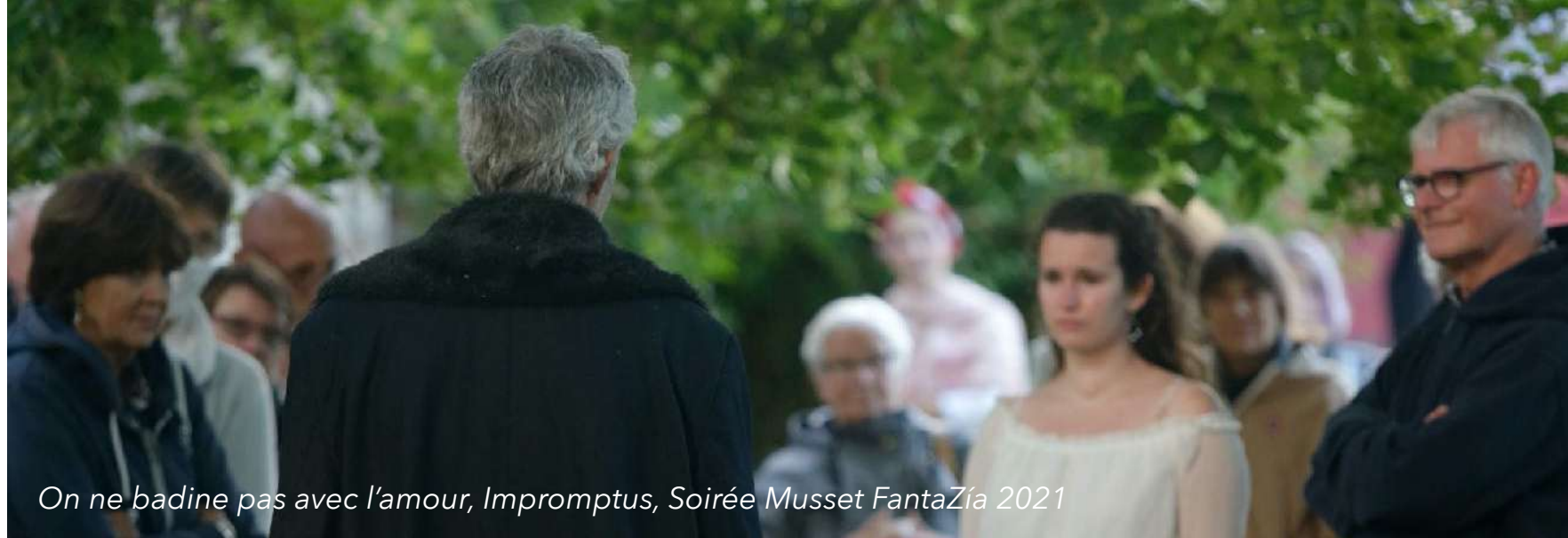
On ne badine pas avec l'amour, Impromptus, Soirée Musset FantaZia 2021