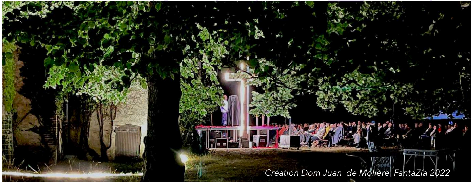
Création Dom Juan de Molière FantaZía 2022