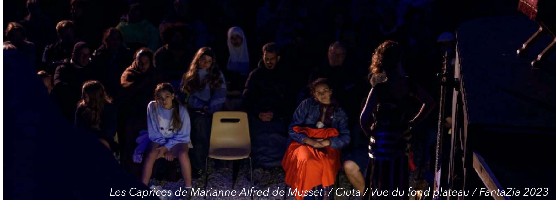
Les Caprices de Marianne Alfred de Musset / Ciuta / Vue du fond plateau / FantaZía 2023