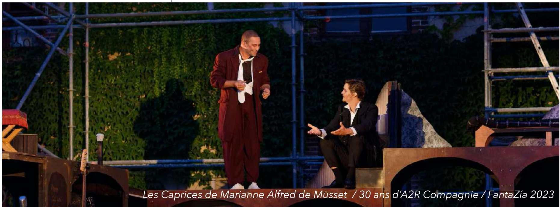
Les Caprices de Marianne Alfred de Musset / 30 ans d'A2R Compagnie / FantaZía 2023